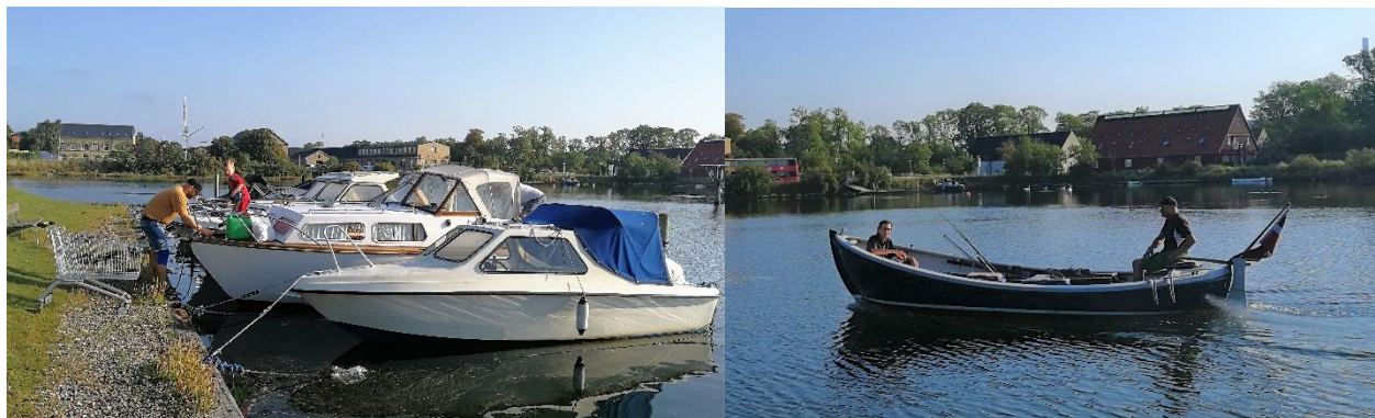
Fig. 1 GRANDMA gøres klar, mens BOREAS allerede er for udgående.